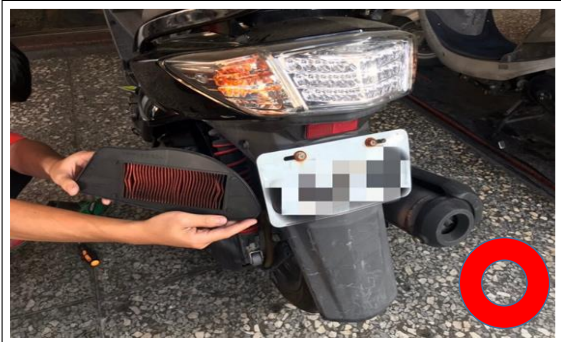
正確範例：車牌及更換前之空氣濾清器須確實拍攝(如上圖)