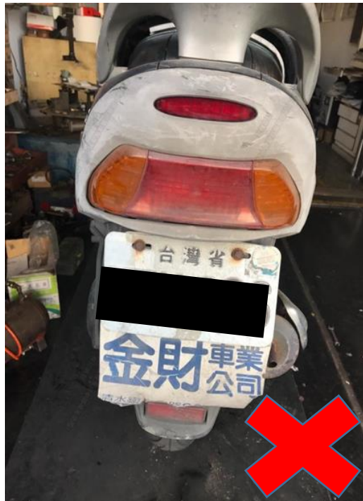
未拍攝更換下空氣濾清器