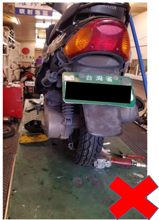
空氣濾清器卸下放置於地面無法辨識