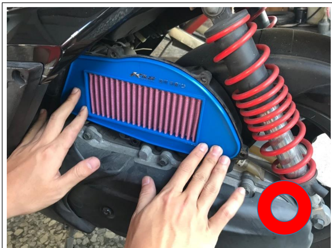
正確範例：更換後之空氣濾清器與裝設位置須確實拍攝(如上圖)